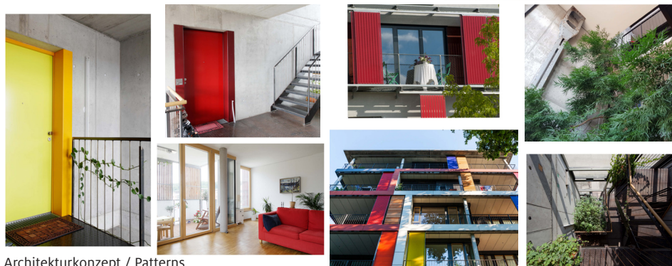
Architekturkonzept / Patterns